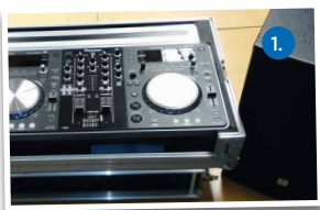
1. XDJ-R1-Mischpult, Endstufe, Aktivboxen, Fußmikro

* Kartusche à 108 Fotos (10x15) + 30,00 €