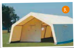
Gruppenzelt 10,0 x 5,65 x 2,80 m