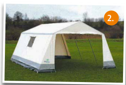
Gruppenzelt für 10 Personen 5,4 x 4,5 m