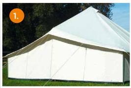
Pyramidenzelt für 9 Personen 4,8 x 4,8 m