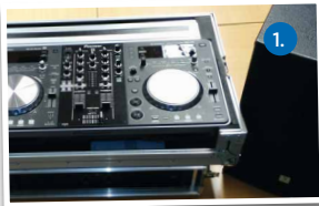
1. XDJ-R1-Mischpult, Endstufe, Aktivboxen, Funkmikro

* Kartusche à 108 Fotos (10x15) + 30,00 €