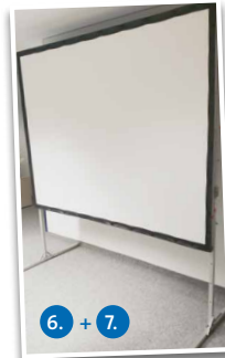
6. + 7. Ein Leinwandssystem - zwei verschiedene Größen (ALU-Steckrahmen)