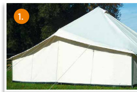
1. Pyramidenzelt für 9 Personen 4,8 x 4,8 m