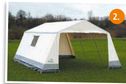
2. Gruppenzelt für 10 Personen 5,4 x 4,5 m