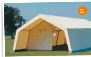
3. Gruppenzelt 10,0 x 5,65 x 2,80 m